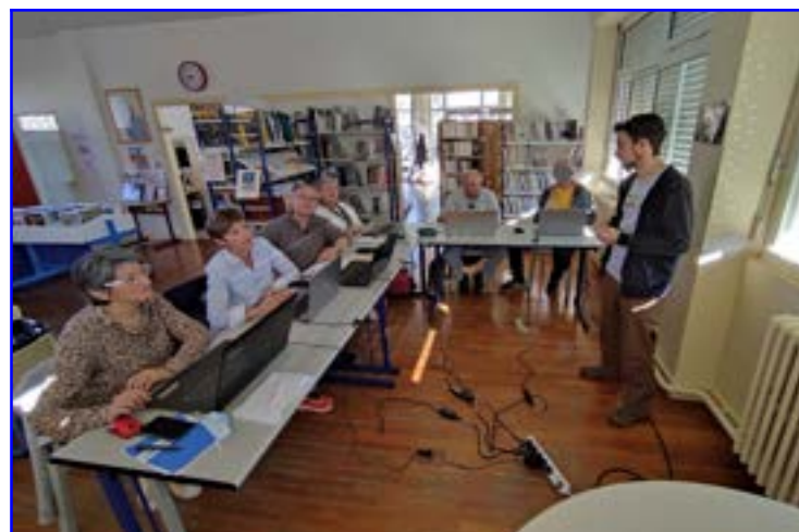
HBA met à disposition des PC pour ceux qui n'en ont pas.

Cette quatrième séance avait également pour objectif de scanner un document avec son smartphone et de